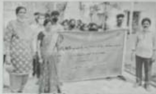
కార్గర్ మంలో కార్గర్ జోగి అగ్గవ్వు విద్యార్థులు, వర్మంట్ అగ్గవ్వు తలవారులు

తగవులేదని, విద్యార్థులు క్రమశిక్షణలో నడచుకోవాలని ఓమిలి జిల్లాలోని నమ్మిరు గారు చెప్పారు. మారులారు ఓమిలి ఎస్సెస్సెస్సెస్ ప్రభుత్వ కేగ్ కళాశాల ఎస్సెస్సెస్ యూనిట్ - 1, 2 ప్రత్యేక సీనా కేగ్ కళాశాల వందలో అదివారం అయిన ప్రారంభించారు. ఓమిలి కార్గర్ అనే ముంజాల అభ్యుత్తర ప్రారంభించిన కార్గర్ మంలో వర్మంట్ జోగి అగ్గవ్వు చెప్పారు. ప్రభుత్వ సంక్షేమ పథకాలు ప్రజలకు చేరడా విద్యార్థులు తమవంతు సాయం అందించాలని కోరారు. ప్రజలను సమాజానికి అందించేందుకు ఎక్కువగా ముందుగా వ్యాధి, అనంతరం యాతపేట, ఎస్సెస్ కాలనీలో కోవిడ్ - 19 వ్యాక్సినేషన్ పట్టి నిర్వహించారు. కార్గర్ మంలో యూనిట్ - 1, 2 ఓమిలి కార్గర్ జోగి, ఎస్ అప్పారావు యను, ఉప వర్మంట్ సింగ్ పూర్ అభ్యుత్తర, వైఎస్సెస్సెస్