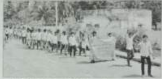
ర్యాలీ నిర్వహిస్తున్న ఎన్.ఎస్.ఎస్ విద్యార్థులు

తగరపువలస: ఇంటింటా టాయిలెట్లు ఏర్పాటు చేసుకుంటే గ్రామాల్లో ప్రజలు ఆరోగ్యంగా ఉంటారని ఓపిఠి శ్రీవ రామా ఆర్ట్స్ నరసింహస్వామి ప్రభుత్వ డిగ్రీ కళాశాల ఎన్.ఎస్.ఎస్ యూనిట్ - 1, 2 విద్యార్థులు సోమవారం ప్రచారం చేశారు. జాతీయ సేవా పథకం మూడో రోజు కార్యక్రమం లో భాగంగా శాశ్వతమైన పందాయతీ యాత్రపేట, ఎస్పీ కాలనీలో ర్యాలీ నిర్వహించారు. అందరికీ వ్యక్తిగత టాయిలెట్లు ఉన్నాయా లేదా అని సర్వే చేశారు. పరిసరాల పరిశుభ్రతపై ఆవగాహన కలిగించారు. ఆనంతరం ప్రస్తుత తీవ్ర వర్షానికి యోగా ఆవశ్యకత, మెడిటిషన్, ఆననాలను